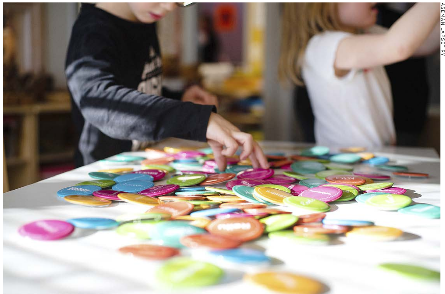
Friends-kurssilla opitaan tunteiden tunnistamista ja nimeämistä sekä huomataan, millaista viestiä puhutaan itselle ja miten se vaikuttaa käyttäytymiseen. Friends-kurssi on kansainvälinen toimintamalli, jota hallinnoi Suomessa Aseman Lapset ry.

– Kurssilla oppii ja kertaa samalla myös itse näitä tärkeitä taitoja ja huomaa, että